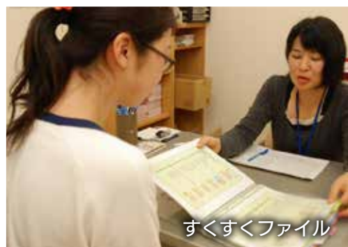
すくすくファイル