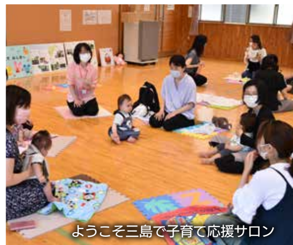
ようこそ三島で子育て応援サロン