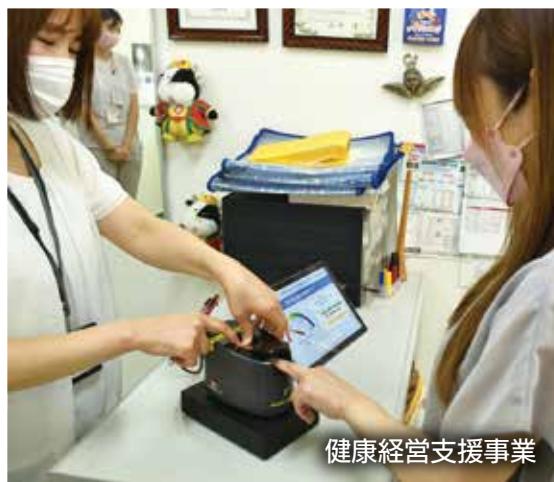
健康経営支援事業