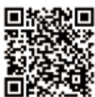
景観重点 整備地区