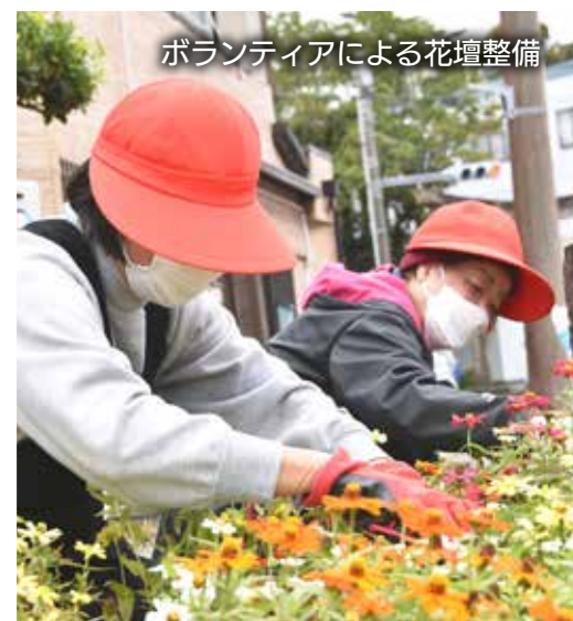
ボランティアによる花壇整備