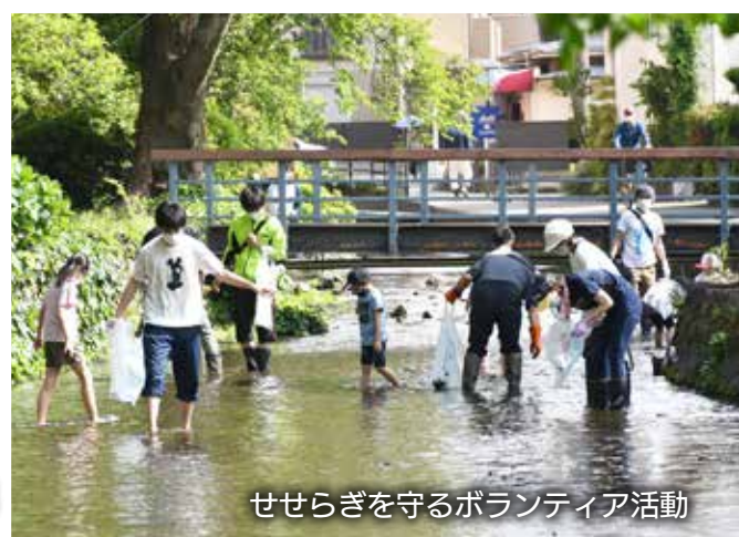
せせらぎを守るボランティア活動