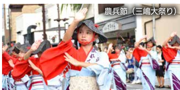
農兵節 (三嶋大祭り)