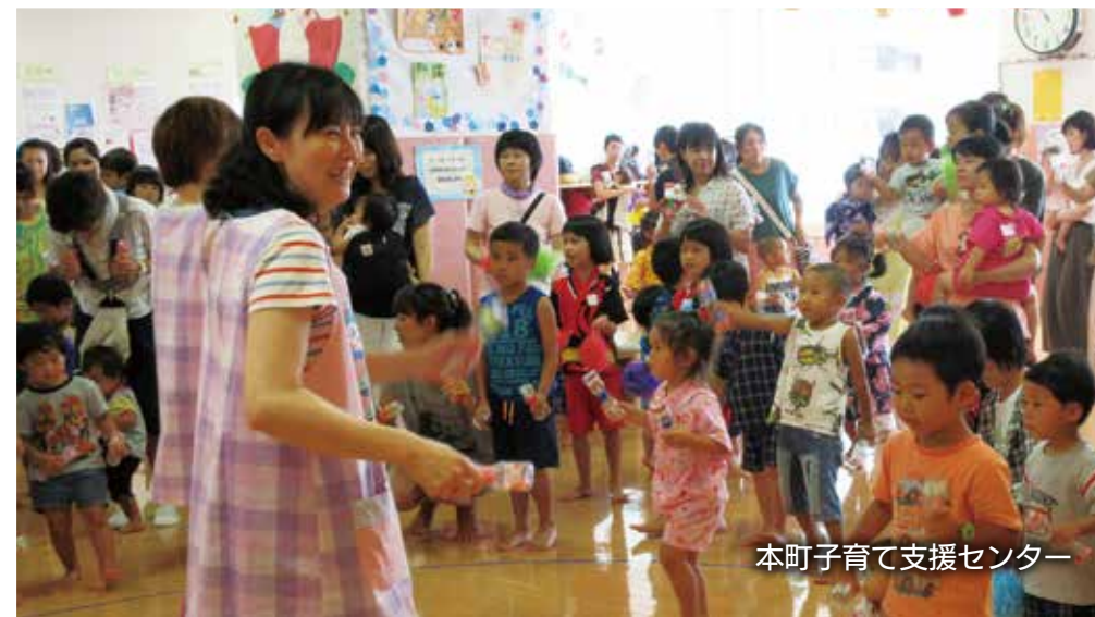
本町子育て支援センター