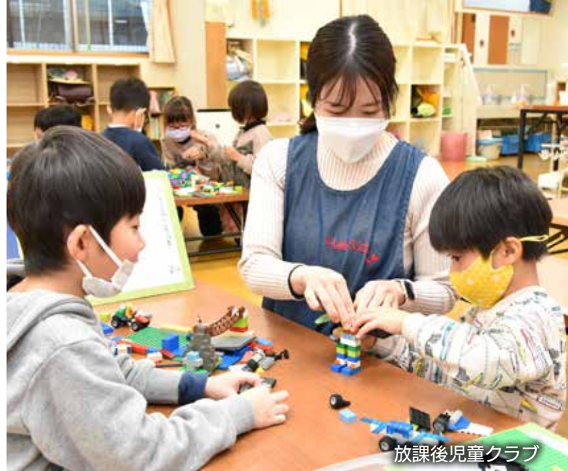
放課後児童クラブ