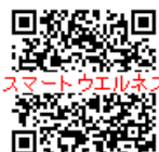
スマートウエルネス みしま