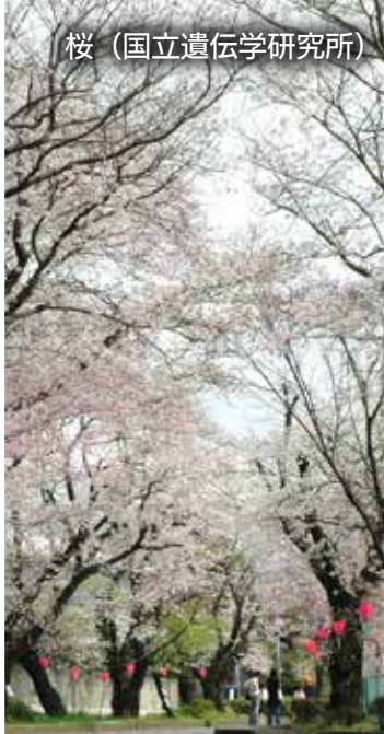
桜 (国立遺伝学研究所)