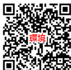
環境への取り組み