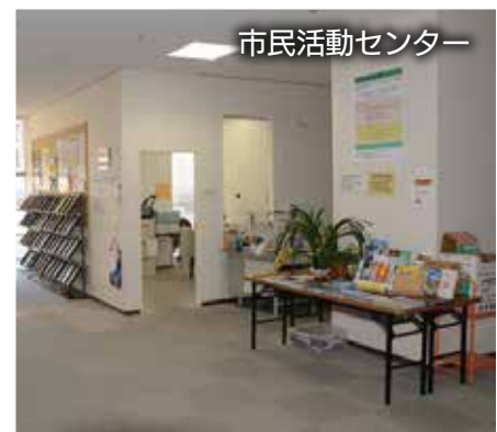
市民活動センター