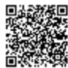
水道課ホームページ

※使用休止の届出がない場合、水道料金の請求は続きますのでご注意ください。転居・転出手続きとは異なります。※詳細は水道課ホームページをご覧ください。