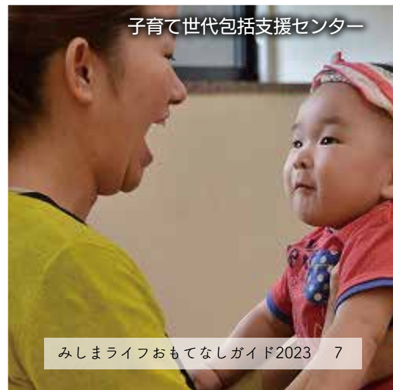
子育て世代包括支援センター