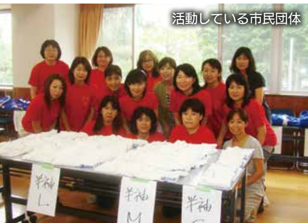
活動している市民団体