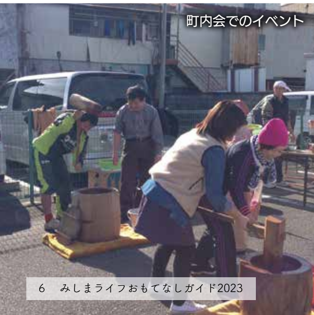
町内会でのイベント