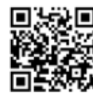
納付方法について