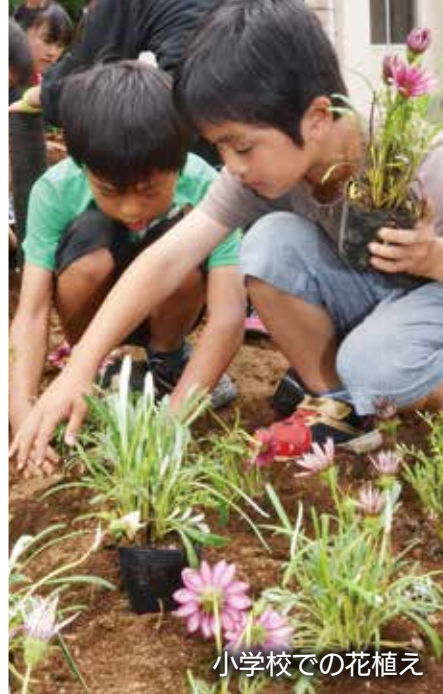
小学校での花植え