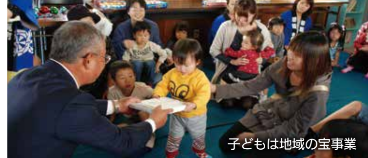
子どもは地域の宝事業