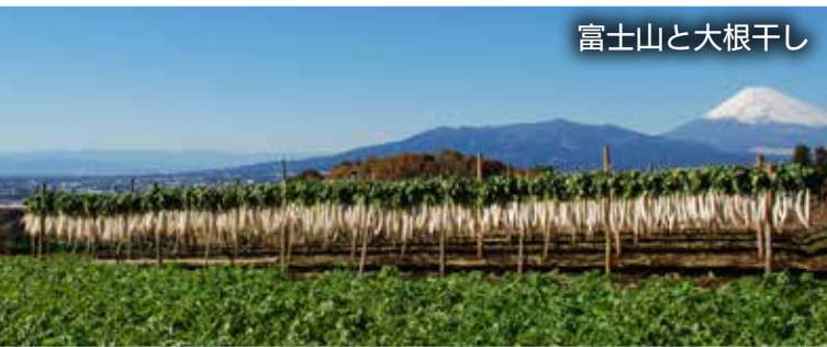
富士山と大根干し