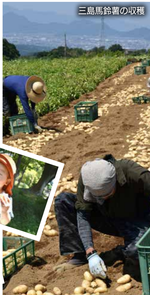
三島馬鈴薯の収穫