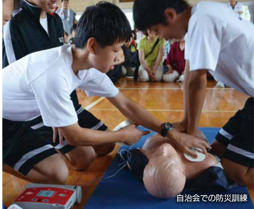
自治会での防災訓練