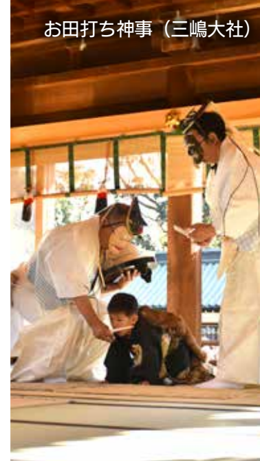
お田打ち神事 (三嶋大社)