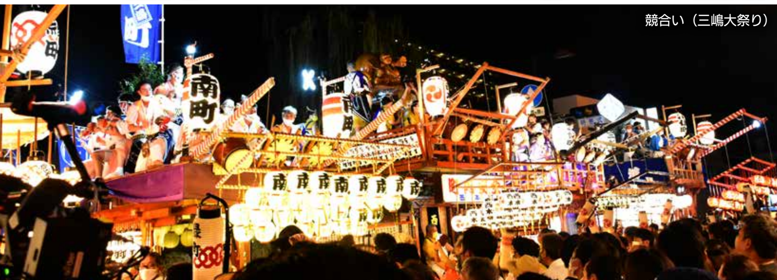
競合い(三嶋大祭り)