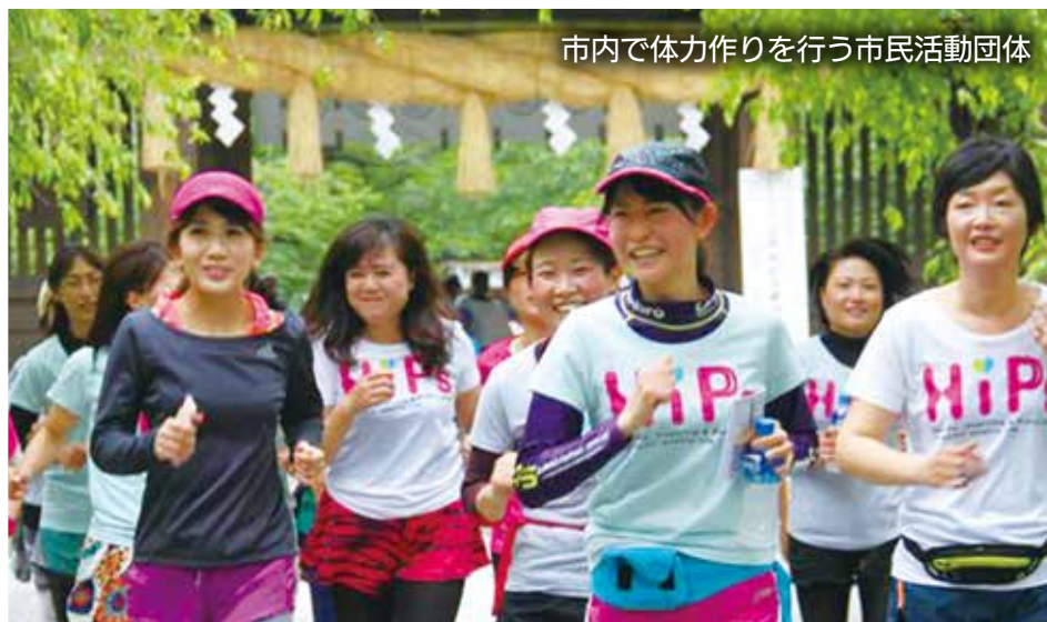
市内で体力作りを行う市民活動団体