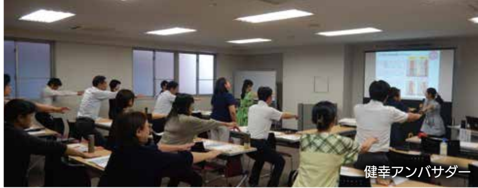
健幸アンバサダー