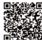
後期高齢者 医療制度