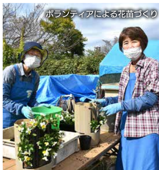
ボランティアによる花苗づくり