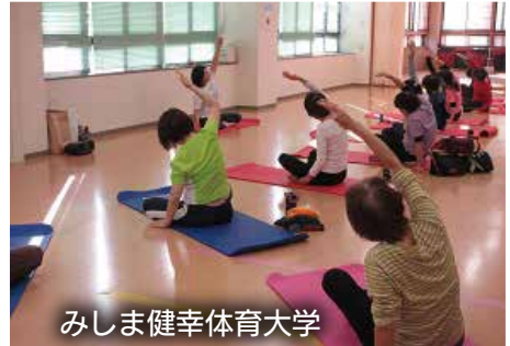
みしま健幸体育大学