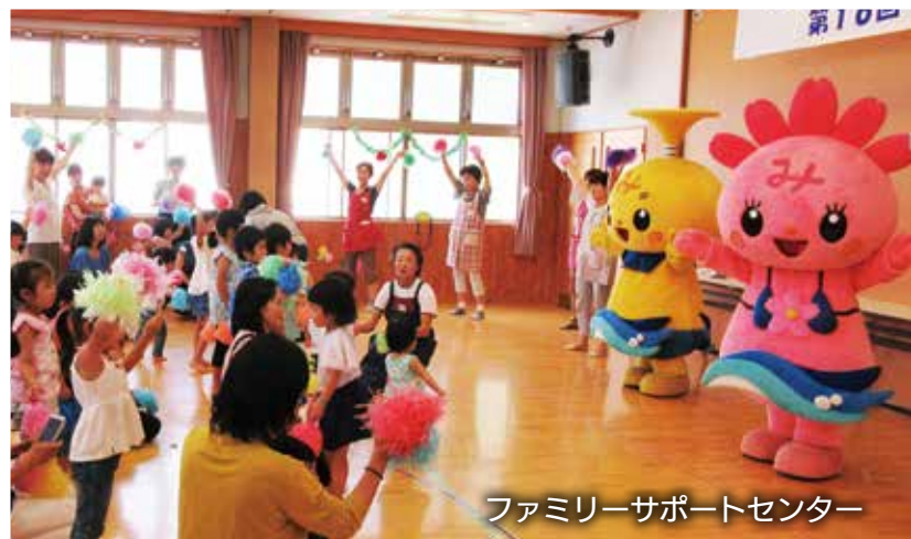
ファミリーサポートセンター