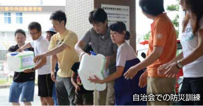
自治会での防災訓練