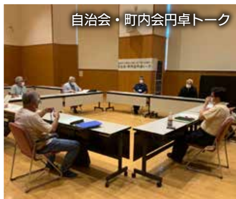
自治会・町内会円卓トーク